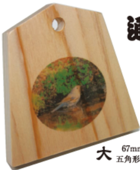
大 67mm×67mm 五角形 厚み 10mm