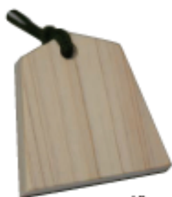
小 40mm×40mm 五角形 厚み 8mm